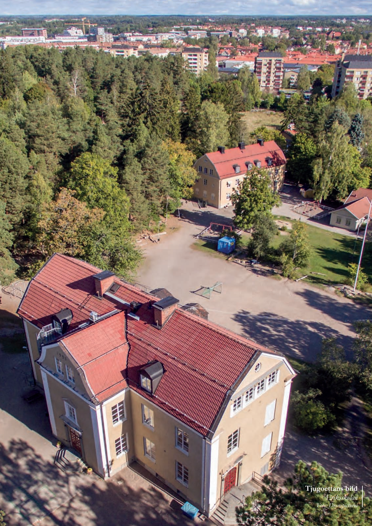
Tjugoettans bild Eriksskolan