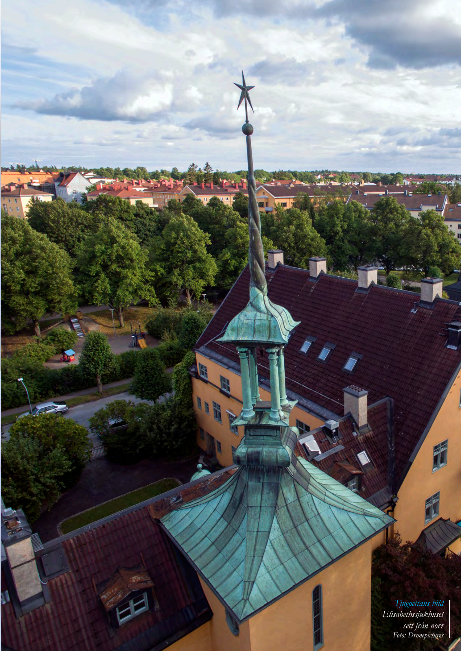
Tjugoettans bild Elisabethsjukhuset sett från norr