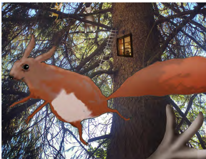
Illustration: Berenike Ström.