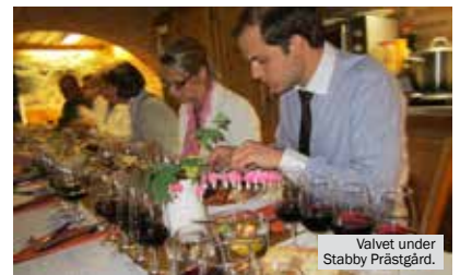
Valvet under Stabby Prästgård.

Öppet torsdagar 16-20 eller efter överenskommelse på tel 018-432 01 94.